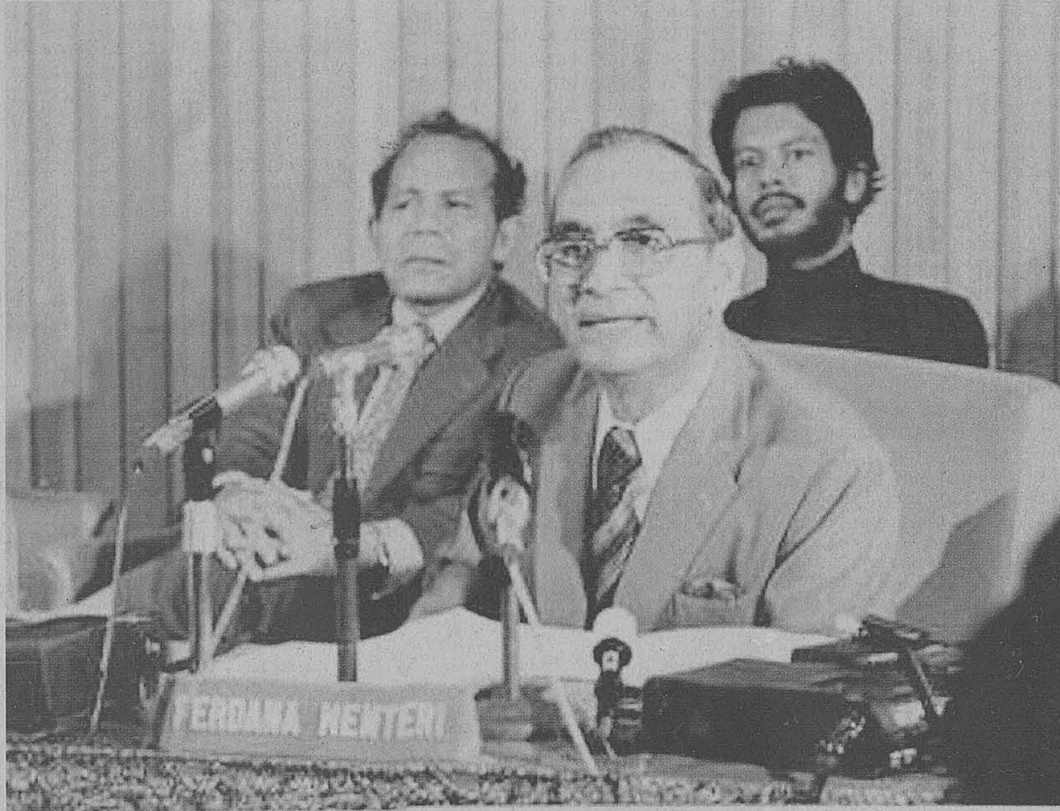
BAPA PERPADUAN: Jasa dan bakti Allahyarham Tun Hussein kepada agama, bangsa dan negara tidak ternilai.

Ketua Pemuda Umno yang pertama dan pada tahun berikutnya sebagai Setiausaha Agung Umno. Selain itu juga beliau turut menjadi Ahli Majlis Undangan Negeri Johor, Ahli Majlis Persidangan Persekutuan dan anggota Suruhan Jaya Tertinggi Perkhidmatan Awam.