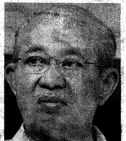
Tengku Razaleigh Hamzah

“Dialah yang menyebabkan Umno kalah. Dialah yang menyebabkan Kelantan jatuh kepada Pas (ketika Tengku Razaleigh bersama Semangat 46 pada Pilihan Raya Umum 1990)”