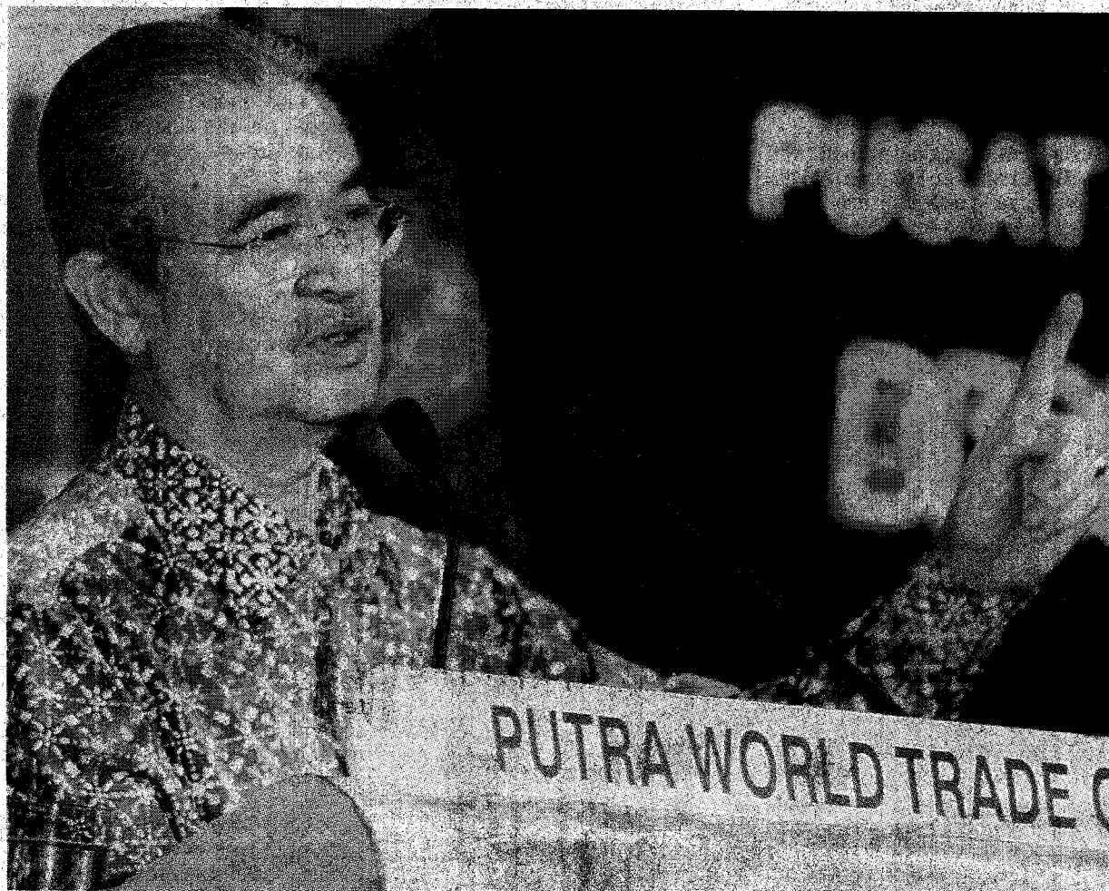
BERI PENJELASAN: Abdullah menyampaikan amanat kepada 1,000 Ketua Penerangan Umno pada Majlis Penerangan Bersama Presiden Umno di PWTC, semalam.

Pihak buat pelbagai tuduhan tidak bertanggungjawab, ada kepentingan peribadi