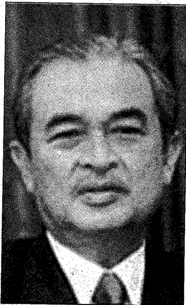
Pak Lah.. yang mahu bekerjasama dengan Singapura.

Janganlah kita termakan dengan janji-janji manis dari Kerajaan Singapura kerana sejarah telah membuktikan yang mereka tidak boleh dipercayai. Contoh yang