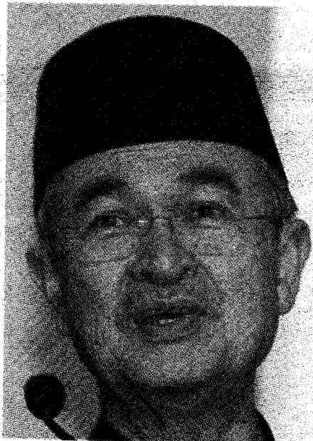
ABDULLAH AHMAD BADAWI

"Sekarang Tun sedang membawa UMNO kepada satu lagi kehancuran. Tun mahu UMNO berkubur. Tun akan hanya meredakan serangan terhadap Pak Lah apabila beliau melihat Pak Lah berundur. Tun enggan membantu parti yang