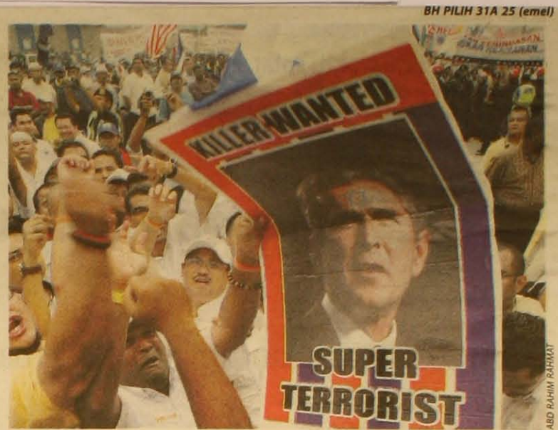
PERHIMPUNAN mengutuk serangan Israel ke atas Palestin dan Lubnan di depan Kedutaan Amerika Syarikat di Kuala Lumpur, Julai 2006.