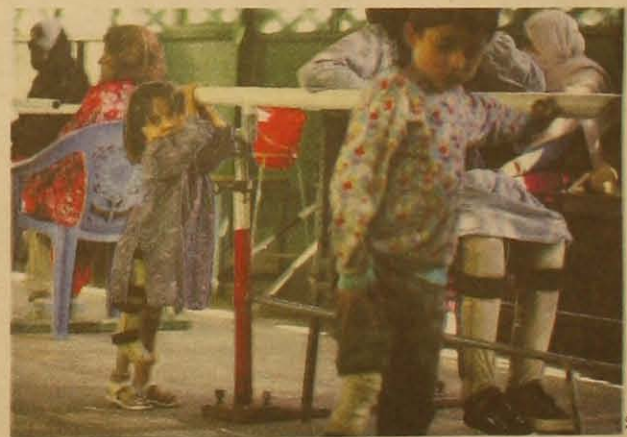
KANAK-KANAK Afghanistan di pusat orthopedik di Kabul. Ramai Kanak-kanak di negara itu cacat anggota badan angkara perang dan konflik.

Untuk maklumat lanjut mengenai PGPO, layari laman web www.perdana4peace.org dan www.criminalisewar.org