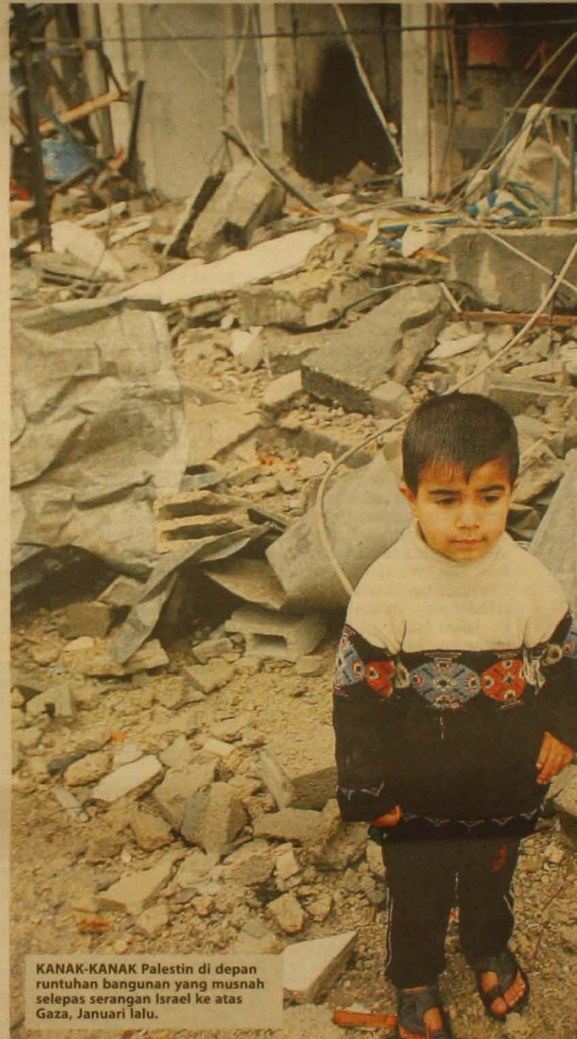
KANAK-KANAK Palestin di depan runtuhan bangunan yang musnah selepas serangan Israel ke atas Gaza, Januari lalu.

“Kita boleh mencadangkan supaya sesiapa yang ingin jadi calon pilihan raya presiden, kongres atau ahli Par-