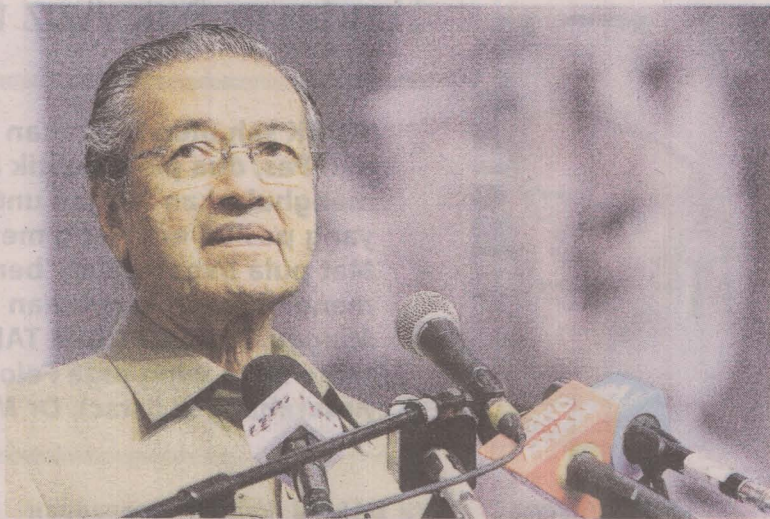
SATU keistimewaan ketara ada pada Dr Mahathir ialah berani menyatakan apa yang beliau dapati benar dan penting untuk dihebahkan.

Orang Melayu di Malaysia kini tidak selesa lagi dengan kedudukannya dalam bidang politik, bimbang dengan kedudukannya di dalam bidang ekonomi dan takut hi-