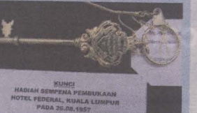
KUNCI , hadiah sempena pembukaan Hotel Federal.