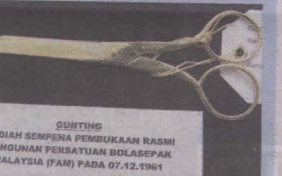
GUNTING , hadiah sempena pembukaan bangunan FAM.