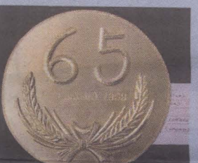
HADIAH sempena hari jadi Tunku yang ke-65.