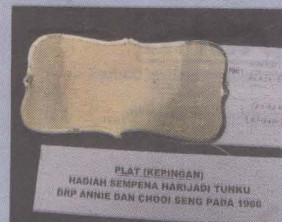
KEPINGAN plak, hadiah sempena hari jadi Tunku.