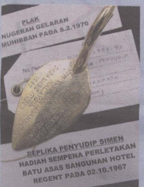
PENYUDIP simen, cenderamata sempena perletakan batu asas Hotel Regent.