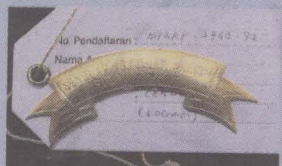
PLAT (KEPINGAN) HADIAH SEMPENA PEMBUKAAN RASMI SEKOLAH ABDULLAH MUNSYI PULAU PINANG