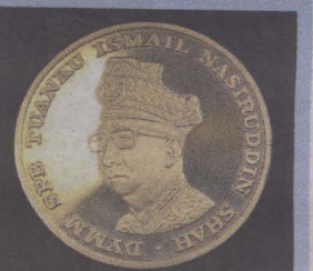
SYILING emas pemberian Yang di-Pertuan Agong.