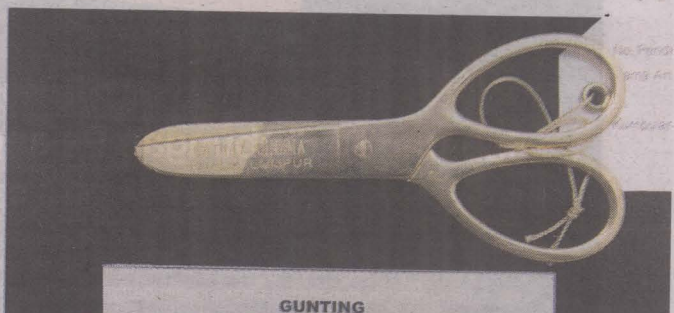
GUNTING bersadur emas, cenderamata sempena pembukaan Cathay Cinema pada 1958 antara 14 gunting yang diterima Tunku Abdul Rahman.