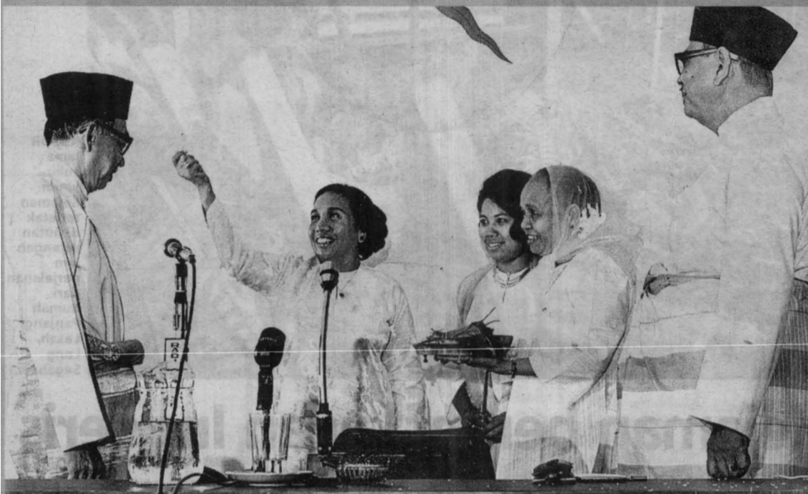
TUN FATIMAH (dua dari kiri) bersama Tun Abdul Razak Hussein dan Tunku Abdul Rahman pada mesyuarat khas Umno.