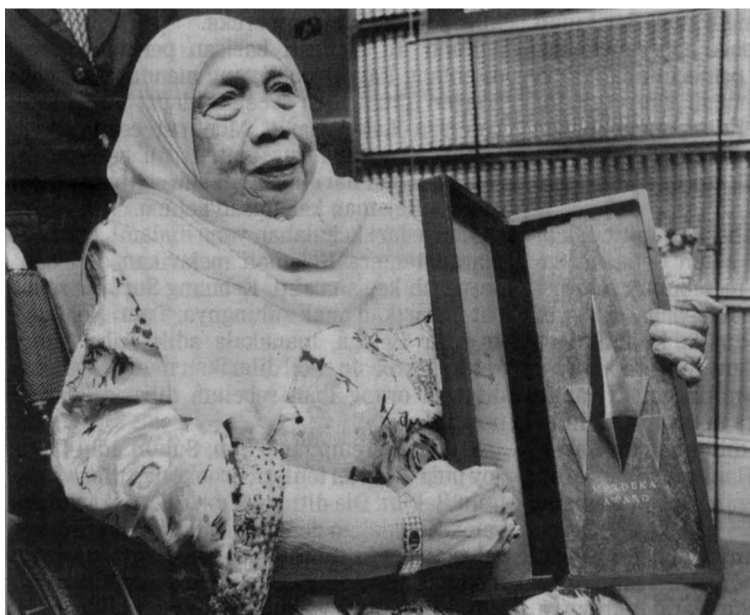
TUN FATIMAH menerima Anugerah Merdeka pada 2009.