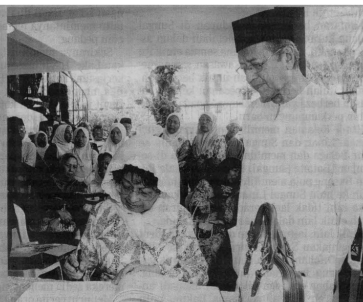
BEKAS Perdana Menteri, Tun Dr Mahathir Mohamad dan isteri, Tun Dr Siti Flasmah Mohd Ali menziarahi jenazah di Bukit Pantai, semalam.

Bekas Menteri Perdagangan Antarabangsa dan Industri, Tan Sri Rafidah Aziz, berkata Allahyarham ialah tokoh yang membuka ruang kepada lebih ramai wanita tanpa mengira latar belakang agama dan bangsa menyertai politik serta pelbagai bidang lain.