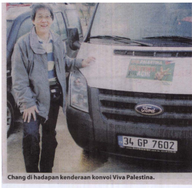
Chang di hadapan kenderaan konvoi Viva Palestina.

"Apabila saya melihat mata mereka, tidak tergambar wajah dendam atau kebencian, sebaliknya pancaran yang mahukan keamanan, cuma bingung kenapa manusia boleh melakukan kejahatan