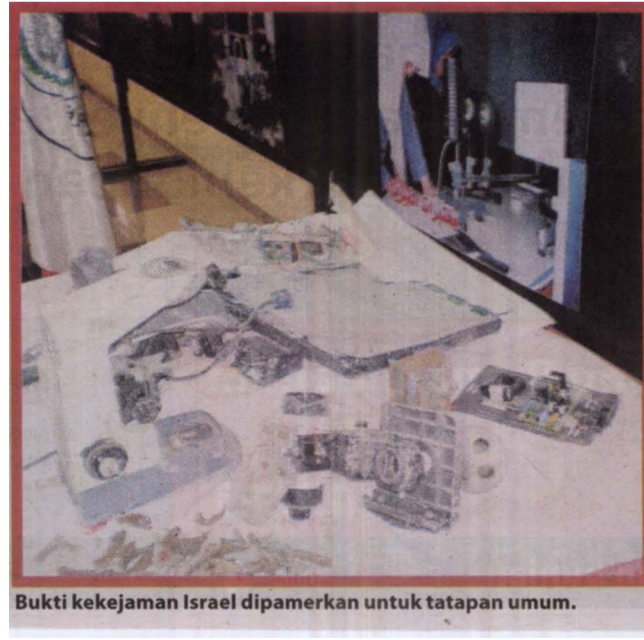
Bukti kekejaman Israel dipamerkan untuk tatapan umum.