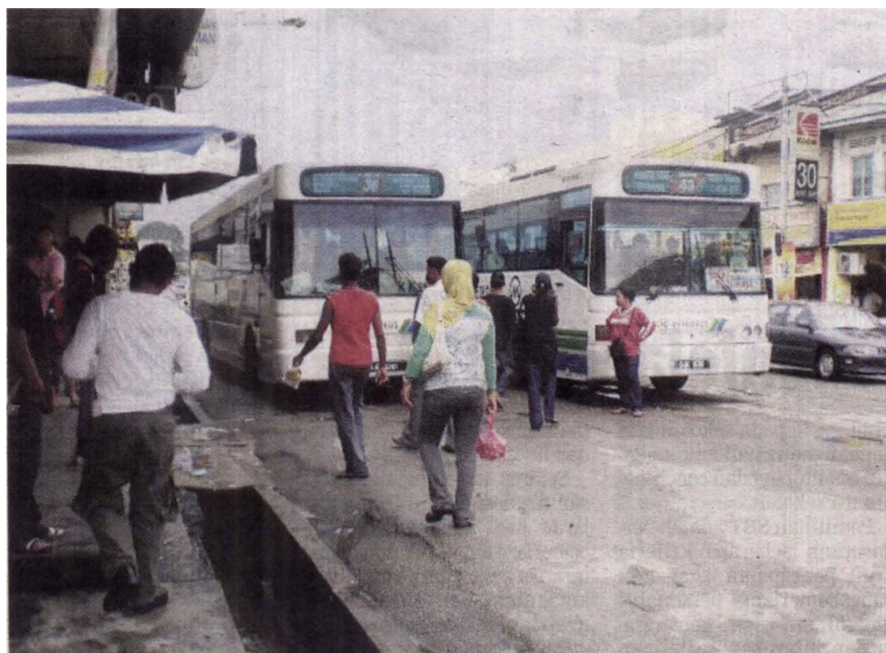
KUALITI perhentian bas sekitar Lembah Klang akan dipertingkatkan bagi menarik orang ramai mengguna bas pada waktu puncak