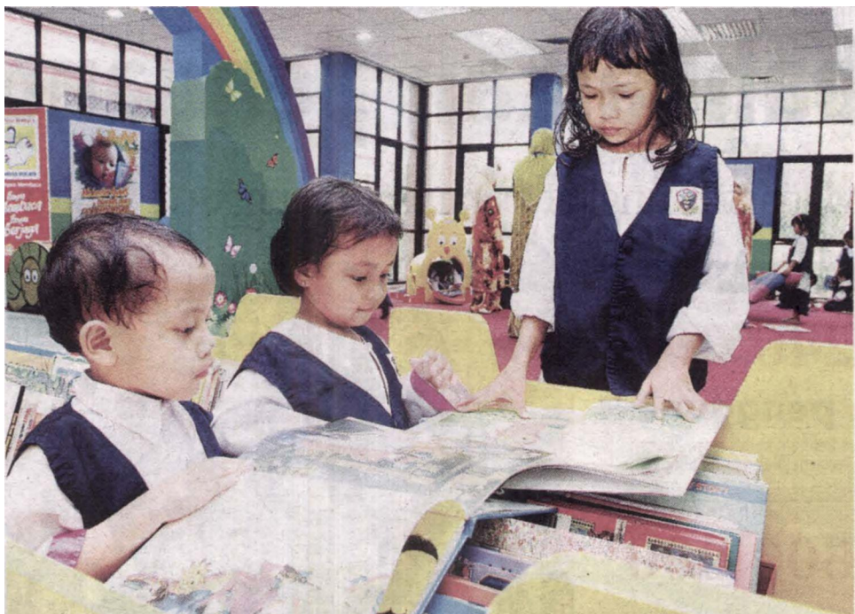
MENINGKATKAN kadar pendaftaran prasekolah untuk kanak-kanak berusia empat hingga lima tahun diberikan tumpuan.

pendaftaran prasekolah untuk kanak-kanak berusia empat hingga lima tahun dan mempertingkatkan kualiti sistem pendidikan.