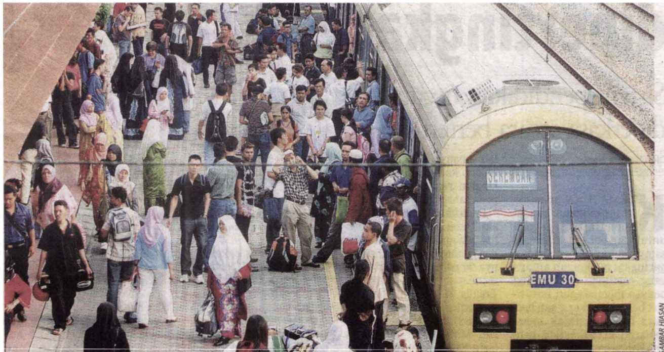
KAPASITI penumpang menggunakan komuter KTM disasarkan meningkat dengan memperbaiki waktu perjalanan dan keselesaan perkhidmatan.

Pada 2012, kapasiti komuter KTM dan LRT akan dipertingkatkan sebanyak 1.7 sehingga empat kali ganda (bergantung kepada laluan