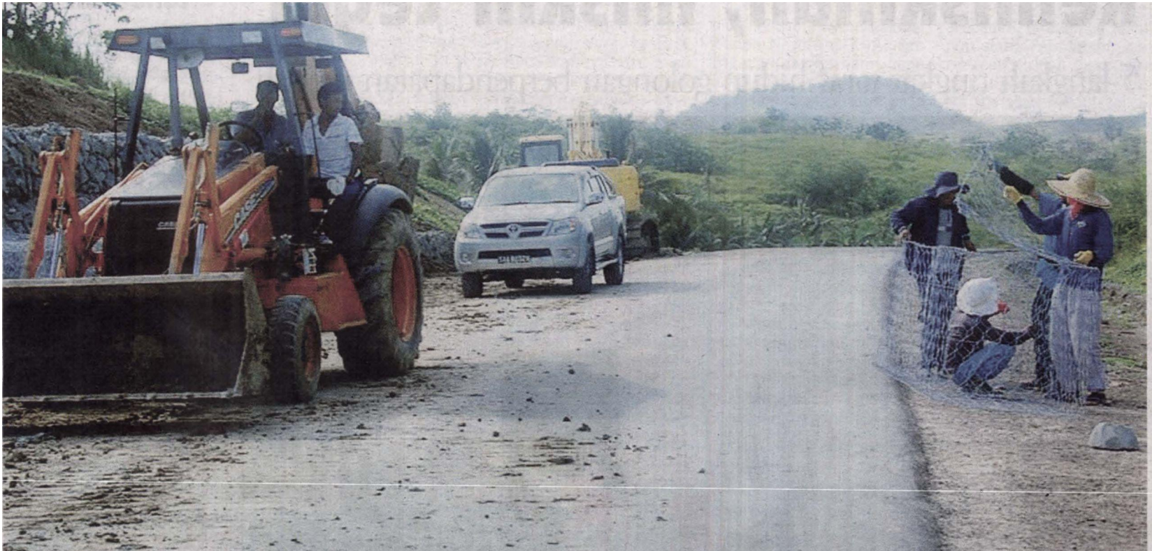
KEMUDAHAN jalan raya antara yang diberi penekanan dalam mempertingkatkan prasarana luar bandar

Kerajaan belanja RM18 bilion dalam tempoh tiga tahun bangun prasarana