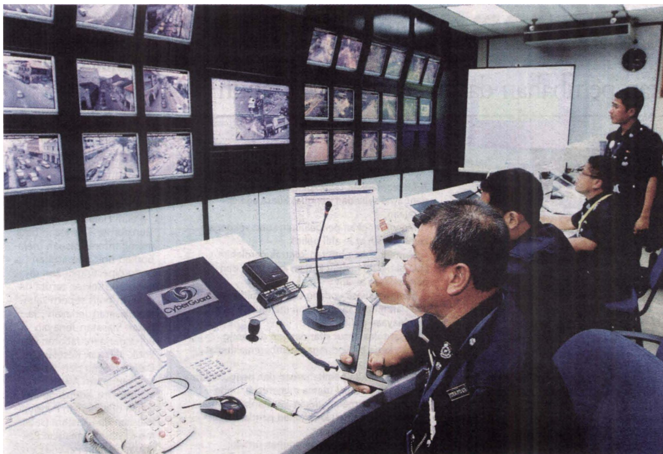
PEMANTAUAN menerusi CCTV antara inisiatif polis perangi jenayah.