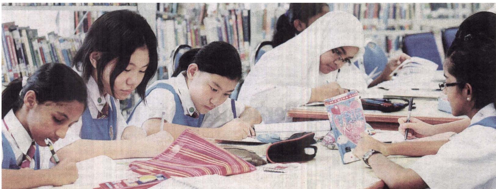
PELAJAR Sekolah Menengah Kebangsaan (P) Sri Aman, Petaling Jaya yang terpilih sebagai Sekolah Berprestasi Tinggi (SBT) mengulang kaji pelajaran di perpustakaan.

• Latihan dan bimbingan bagi mempertingkatkan tahap prestasi.