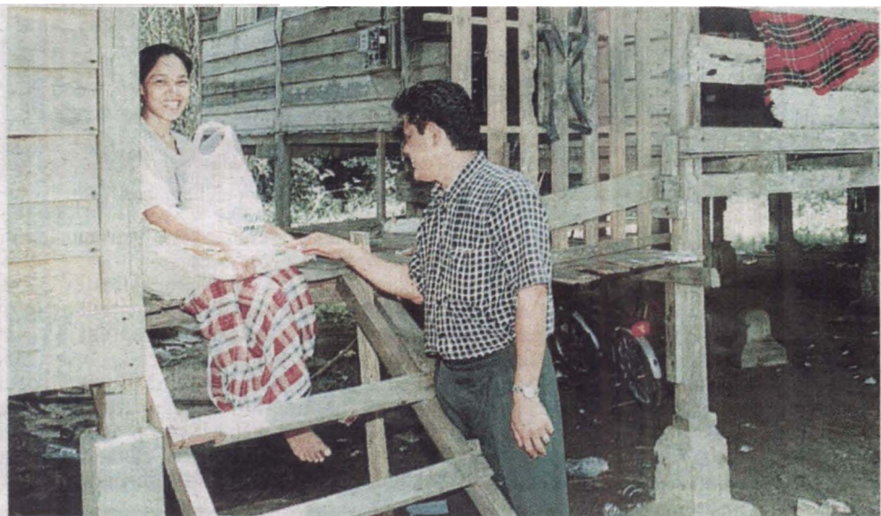
GERAKAN 1 Azam tingkat taraf kehidupan golongan berpendapatan rendah.

Kerajaan juga akan berusaha mengurangkan masa memproses untuk pembayaran bantuan dari tempoh dua bulan yang diamalkan sekarang kepada tujuh hari menjelang 2012 untuk memperbaiki taraf hidup golongan sasaran.