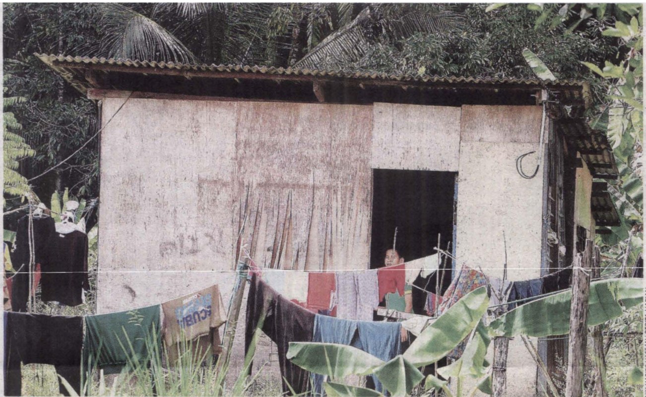
MASIH terdapat lebih daripada 200,000 keluarga diklasifikasikan sebagai miskin.