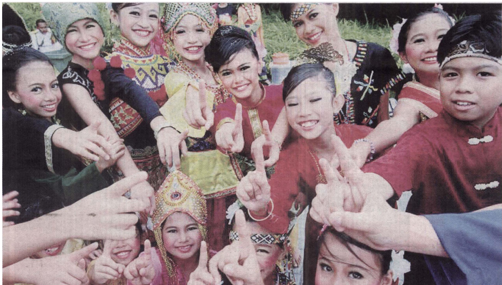
MATLAMAT IMalaysia adalah untuk menjadikan Malaysia lebih berdaya maju, produktif dan berdaya saing.

Rakyat Didahulukan dengan memberi fokus kepada kemahuan dan keperluan mereka, manakala memastikan pencapaian diutamakan melalui ketelusan dan akauntabiliti, selain anjakan paradigma kepada kerajaan untuk meningkatkan tahap ketelusan dan kebertanggungjawaban.