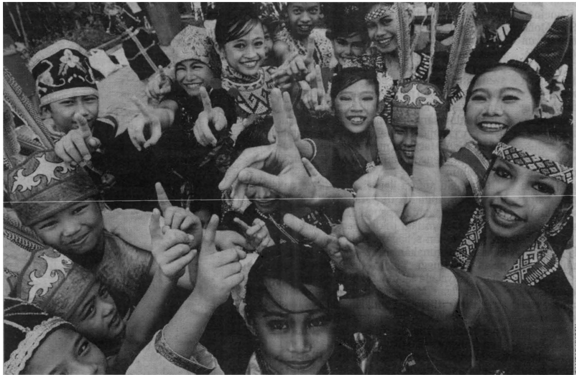
PELAKSANAAN idea kepimpinan Najib yang mengutamakan rakyat dalam pentadbirannya mampu memacu negara setanding dengan negara maju di dunia selain melahirkan rakyat yang harmoni dan bersatu-padu.

Kakitangan awam yang semestinya menjadi tonggak kepada sebarang pelaksanaan dasar kerajaan seharusnya membulatkan tekad untuk menjayakan aspirasi 'bos' mereka, dan dalam konteks ini, Najib adalah 'bos' kepada semua kakitangan awam di semua peringkat, sama ada negeri mahupun Persekutuan, adalah wajar bersatu tekad