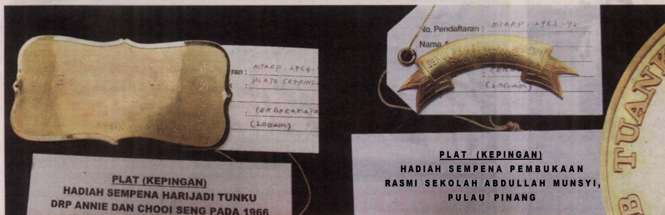
Kepingan plat antara cenderamata yang ditemui dalam peti besi Tunku di Memorial Tunku Abdul Rahman.