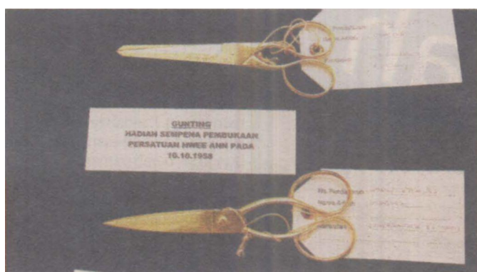
Gunting antara cenderamata yang ditemui dalam peti besi Tunku.