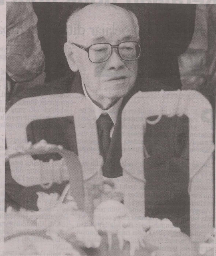
OMAR ketika menyambut hari jadinya yang ke-90 pada 2007.

Beliau juga pernah mengetuai sebuah delegasi pada 1961 untuk menghadiri mesyuarat Jawatankuasa Perundingan Perpaduan di Kuching, Sarawak yang antara