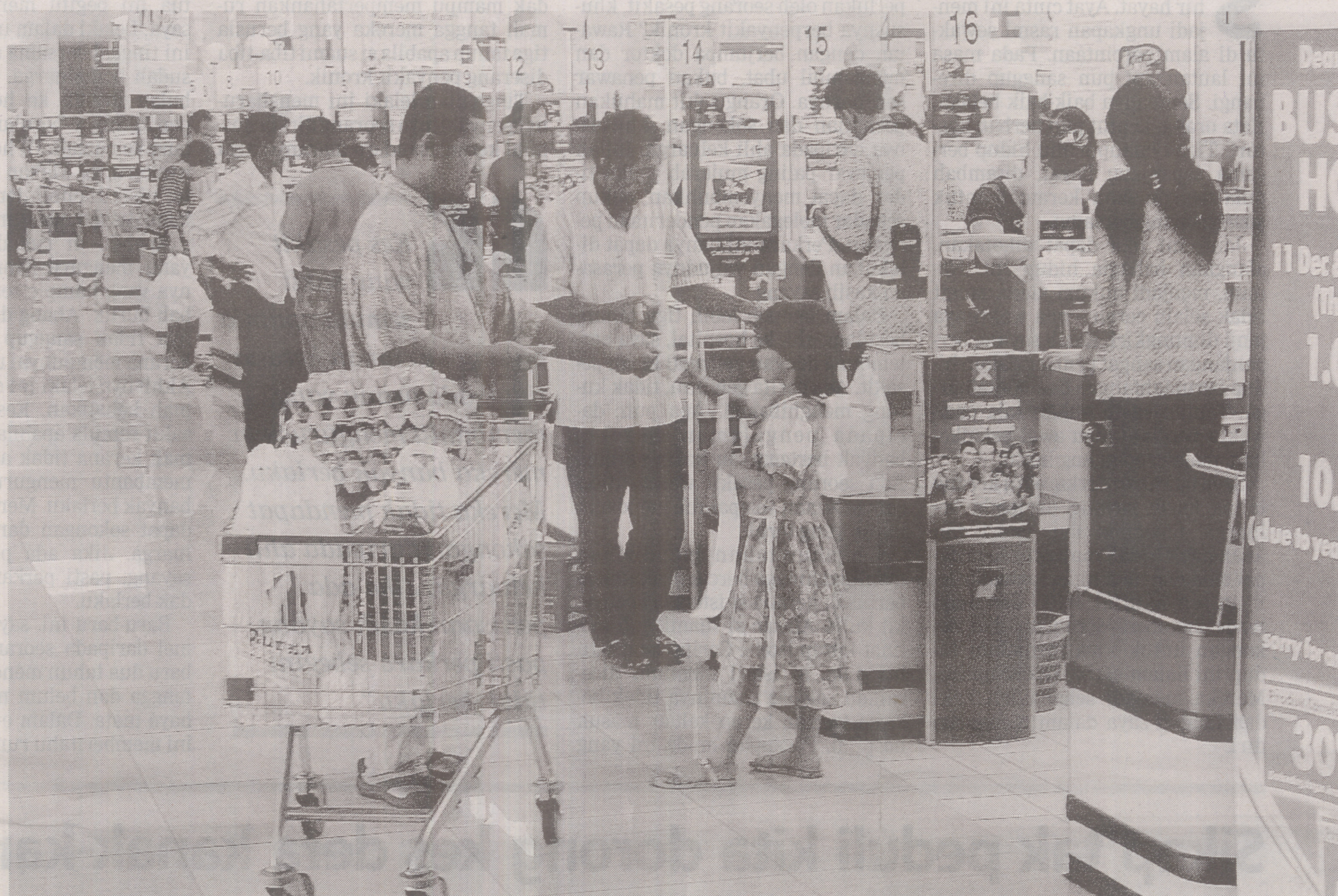
PELAKSANAAN cukai barangan dan perkhidmatan (GST) pada pertengahan 2011 perlu bersifat adil dan tidak membebaskan pengguna.

Namun, sebaliknya 20 peratus barangan di-