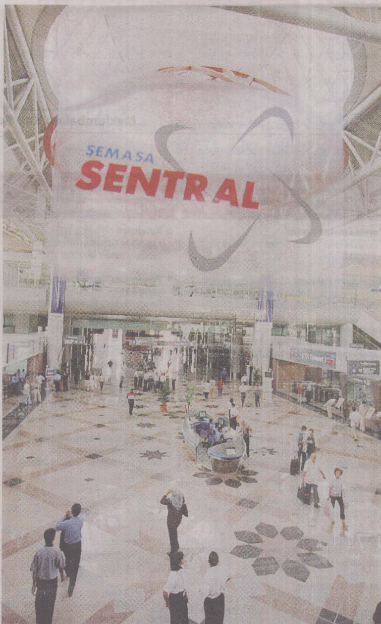
RAKYAT mendapat manfaat prasarana dan infrastruktur lebih baik.

Menjelang 2020 negara akan lebih kukuh dari segi masyarakat, ekonomi