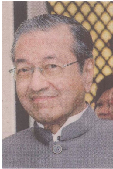
Dr Mahathir Mohamad