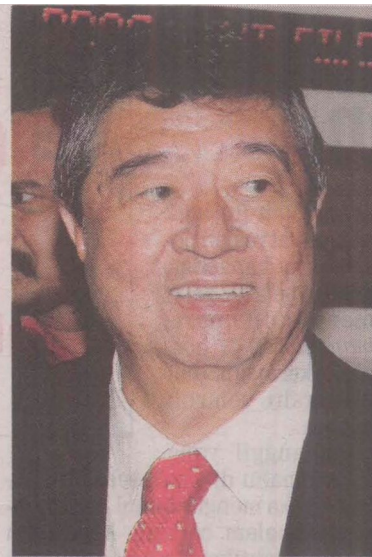
Ling Liong Sik

Liong Sik dituduh menipu dengan memperdayakan Jemaah Menteri untuk memberikan persetujuan pembelian tanah di Pulau Indah untuk projek PKFZ mengikut terma yang dipersetujui antara KDSB dan LPK.