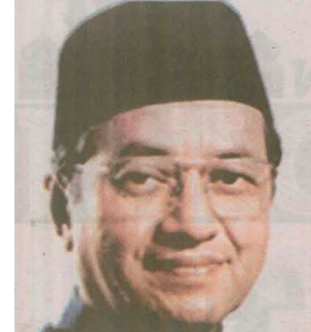
Perdana Menteri Keempat, Tun Dr Mahathir Mohamad Bapa Pemodenan (1981-2003)

Walaupun tempoh beliau menjadi Perdana Menteri agak pendek, tetapi Hussein dikenali sebagai pemimpin konsisten. Hussein meletak jawatan pada 16 Julai 1981 atas sebab kesihatan.