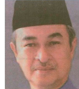
Perdana Menteri Kelima, Tun Abdullah Ahmad Badawi Bapa Pembangunan Modal Insan (2003-2009)

Beliau tidak pernah jemu memperkenalkan pelbagai dasar serta projek pembangunan.