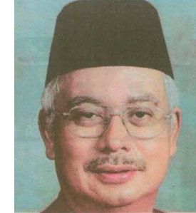
Perdana Menteri Keenam, Datuk Seri Mubd Najib Abdul Razak Bapa Transformasi (2009-kini)

Beliau memainkan fungsi penting program Dr Mahathir, termasuk kempen Kepimpinan Melalui Teladan, Dasar Pensiwaan dan memperbaiki perkhidmatan kaunter agensi kerajaan.