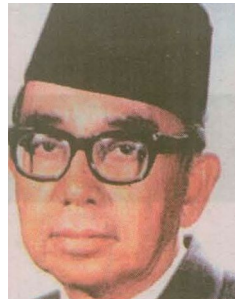
Perdana Menteri Kedua, Tun Abdul Razak Dato' Hussein Bapa Pembangunan (1970-1976)

Tunku juga membentuk Dasar Pelajaran Kebangsaan (1956), Dasar Kebudayaan dan Akta Bahasa Kebangsaan (1963/67) yang menandakan beliau mementingkan pendidikan anak bangsanya.