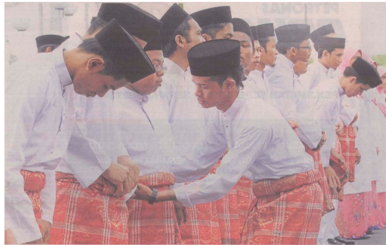
SEBAHAGIAN Pemuda dan Puteri UMNO bersiap untuk raptai penuh pembarisan Perhimpunan Agung UMNO 2011 di Pusat Dagangan Dunia Putra (PWTC), semalam.