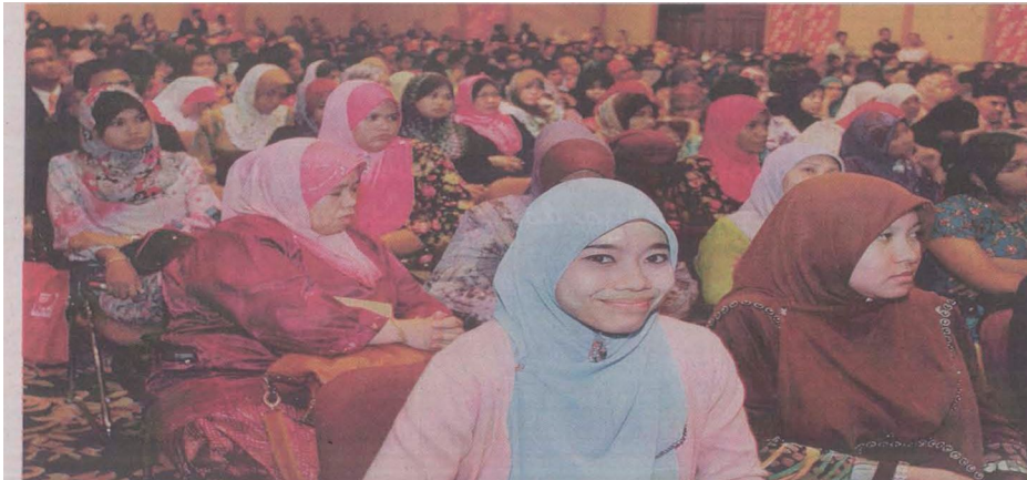
RIBUAN belia dari seluruh Semenanjung yang menghadiri program Bicara Minda Bersama Tun Dr. Mahathir Mohamad di PWTC, Kuala Lumpur, semalam.