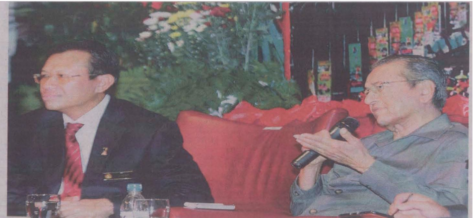
TUN Dr. Mahathir Mohamad bersama Ahmad Shabery Cheek ketika menjawab pertanyaan pemimpin belia pada program Bicara Minda Bersama Tun Dr. Mahathir Mohamad di PWTC, semalam.