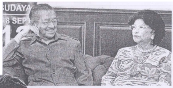
SITI HASMAH mahu dikenang sebagai seorang isteri yang taat kepada suaminya, Tun Dr. Mahathir dan mereka hidup bahagia dengan sokongan antara satu sama lain.

"Walaupun saya tidak berani mengatakan apakah impact yang akan diperoleh selepas teater tersebut dipentaskan kelak, namun besar harapan saya agar ia mampu memberi inspirasi buat pegawai kesihatan wanita khususnya," tambah Siti Hasmah lagi.