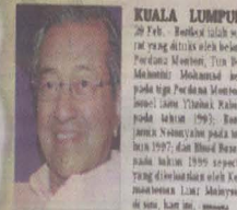
KUALA LUMPUR 26 Feb. - Beliau ialah mentera yang ditulis oleh bekas Perdana Menteri, Tun Dr. Mahathir Mohamad kepada tiga Perdana Menteri Israel: Yitzhak Rabin pada tahun 1993, Benyamin Netanyahu pada tahun 1997, dan Ehud Barak pada tahun 1999 seperti yang diulas dalam artikel ini.