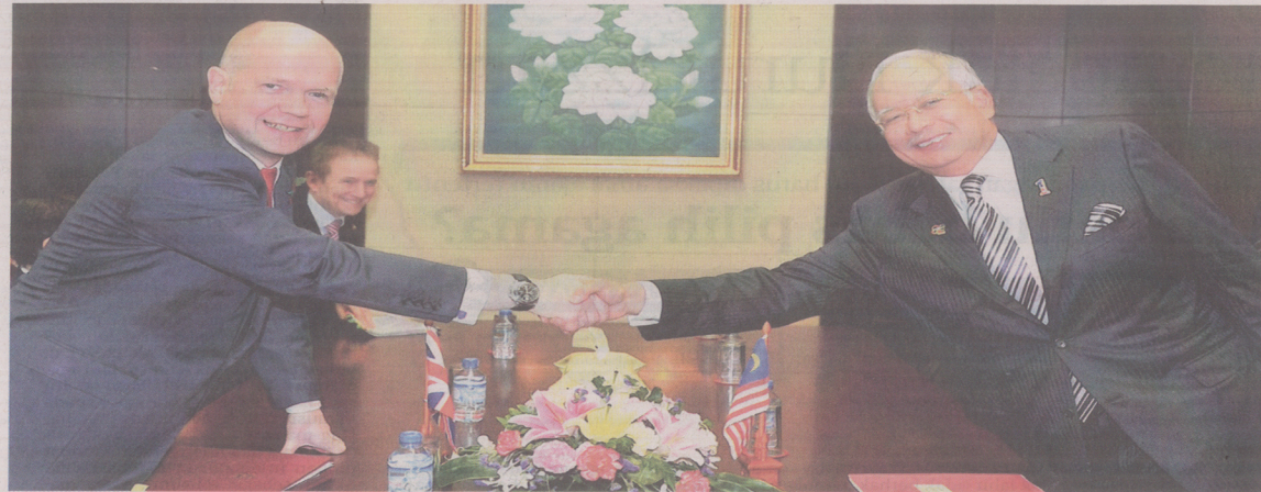
NAJIB Tun Razak berjabat tangan menerima kunjungan hormat William Hague ketika Sidang Kemuncak Asia-Eropah Kesembilan (ASEM) 2012 di Vientiane, Laos, semalam.

tanda-tanda kedua-dua pihak yang bertelagah di Syria mahu mencari penyelesaian," katanya.