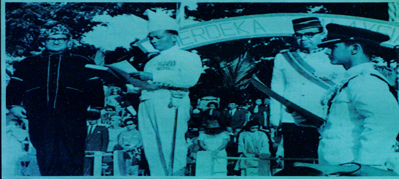
Tun Fuad Stephens bersama Tun Mustapha dan Tun Abdul Razak pada perisytiharan Hari Malaysia.