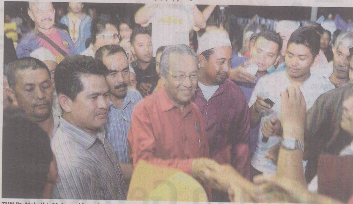
TUN Dr. Mahathir Mohamad bersalaman dengan orang ramai selepas berceramah di Hutan Kampung, Parlimen Pokok Sena dekat Alor Setar, semalam.

Beliau berkata demikian ketika berceramah di Bilik Gerakan Par-