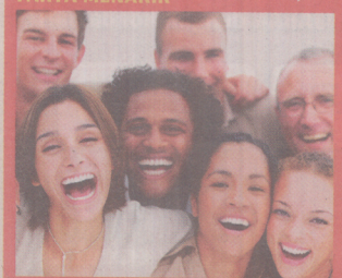
Secara purata, manusia ketawa 15 kali sehari.