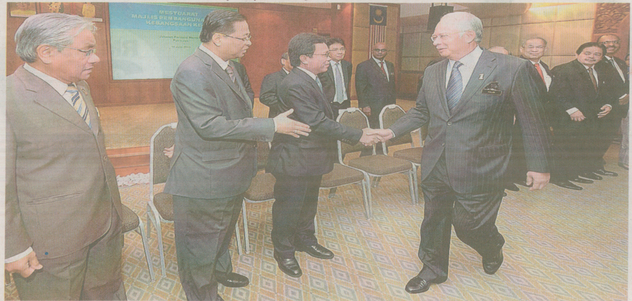
NAJIB Tun Razak disambut Menteri Kemajuan Luar Bandar dan Wilayah, Datuk Seri Mohd. Shafie Apdal, Menteri Pertanian dan Industri Asas Tani, Datuk Seri Ismail Sabri Yaakob (dua dari kiri) dan Menteri Perdagangan Dalam Negeri, Koperasi dan Kepenggunaan, Datuk Hasan Malek (kiri) sejurus tiba bagi mempengerusikan mesyuarat Majlis Pembangunan Perusahaan Kecil dan Sederhana (PKS) Kebangsaan Ke-14 di Bangunan Perdana Putra, Putrajaya, semalam.

Sementara itu Najib berkata Majlis Pembangunan PKS Ke-