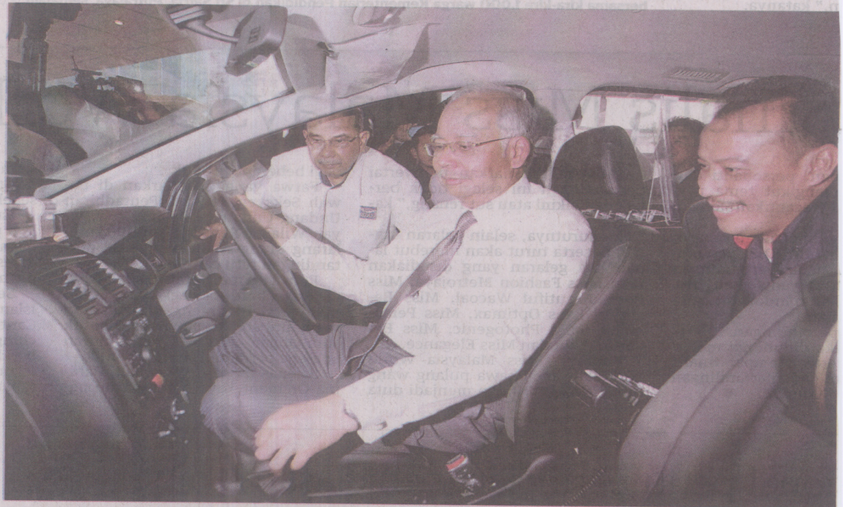
NAJIB Tun Razak mendengar penerangan daripada Lukman Ibrahim mengenai Teksi 1Malaysia (TEKSIM) Proton Exora selepas melancarkan majlis penyampaian 500 lesen teksi individu terakhir di Kuala Lumpur, semalam. Hadir sama Syed Hamid Albar.

Kadar semasa flag-off bagi teksi bajet di Malaysia adalah RM3, dengan bayaran 10 sen dikenakan pada setiap 100 meter berikutnya.