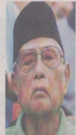
JAMALUL KIRAM III

Malacanang berkata, Presiden Benigno Aquino III akan memaklumkan kepada Perdana Menteri Malaysia, Datuk Seri Najib Tun Razak tentang 'ketua kumpulan pengganas' yang terlibat dengan pencerobohan di Sabah. - AGENSI