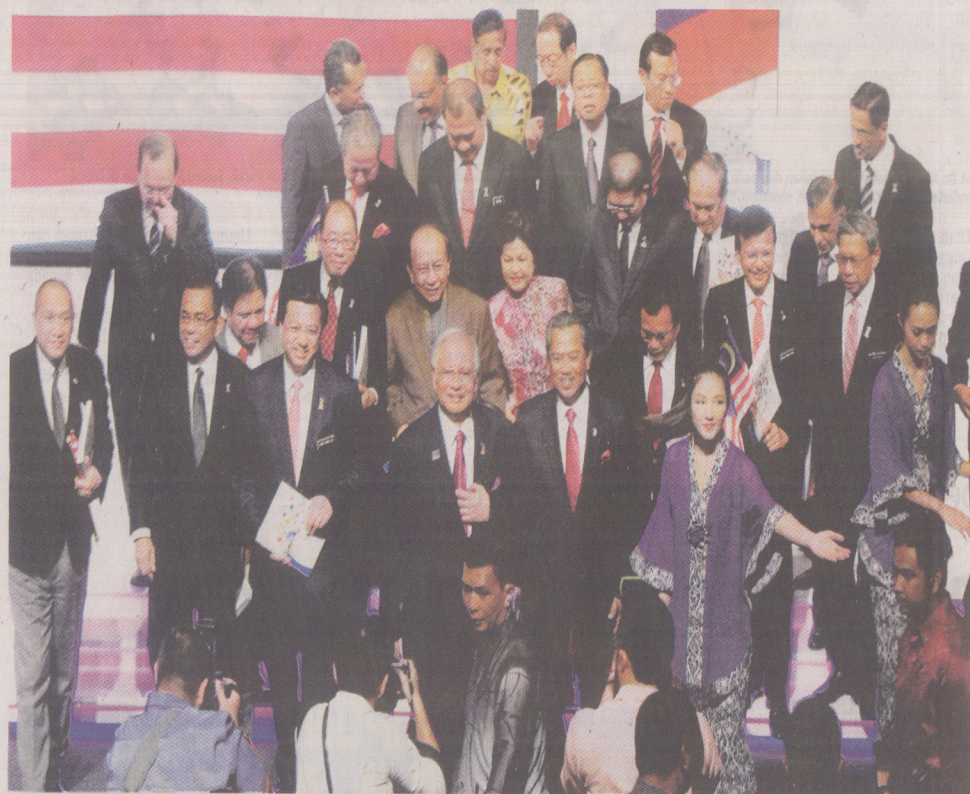
NAJIB Tun Razak bersama para menteri kabinet selepas membentangkan Laporan Tahunan Program Transformasi Kerajaan dan Program Transformasi Ekonomi di Angkasapuri, Kuala Lumpur, semalam.

"Kita menginsafi bahawa hasil pengorbanan pahlawan-pahlawan negara ini seperti mana pada era darurat dan insurgensi telah memungkinkan kemajuan dan kemakmuran kita nikmat hingga hari ini," ujarnya.