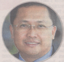
Datuk Seri Idris Jusoh, Menteri Pelajaran dan Pengajian Tinggi II

“ Gabungan kementerian ini adalah cabaran besar, namun saya yakin mampu melaksanakan tanggungjawab yang diberi sebaik mungkin ”