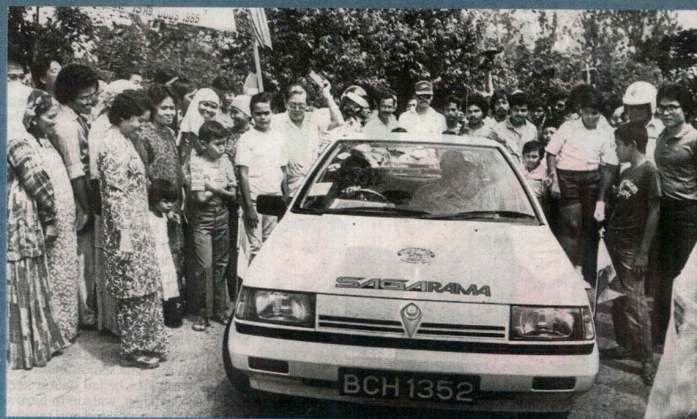
Salah satu daripada dua Proton Saga 1.5S pada majlis prapelancongan.