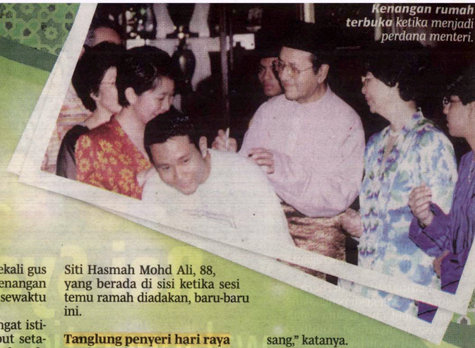
Kenangan rumah terbuka ketika menjadi perdana menteri.

"Tanglung yang dipasang di persekitaran rumah menjadikan waktu malam cerah. Tingkap dan pintu boleh dibuka. Kami bebas dan boleh turun ke bawah rumah, walaupun sudah malam. Pada hari biasa, semua itu tidak berlaku. Itulah menyebabkan hari raya itu lebih meriah dan berbeza daripada hari biasa," katanya. • Muka 7