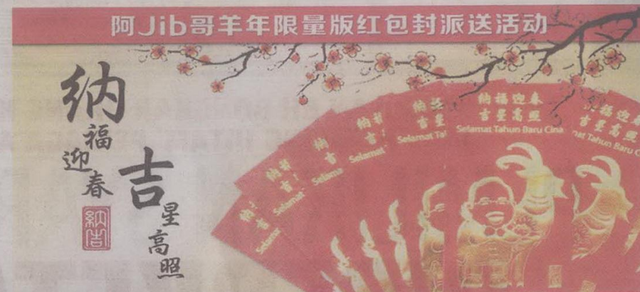
Sampul angpau khas Tahun Baharu Cina yang akan diedarkan secara percuma kepada rakan Facebook 'Ah Jib Gor'.