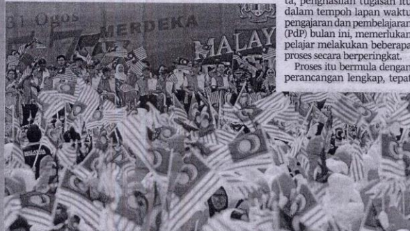
Generasi muda harus menghayati nilai sejarah tanah air.