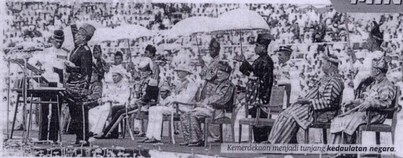
Kemerdekaan menjadi tunjang kedaulatan negara.

Oleh Faizatul Farhana Farush Khan ffarhana@bh.com.my Kuala Lumpur