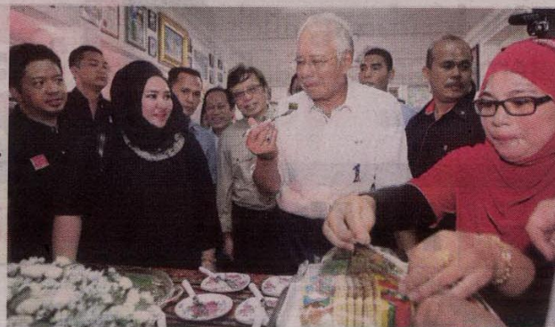
Najib mencuba Kek Lapis Sabok Tun Razak keluaran Mira Cake House ketika melawat Kampung Gersik di Kuching, malam tadi.

Yang hadir sama, Ketua Menteri Sarawak, Tan Sri Adenan Satem; Menteri Kemajuan Luar Bandar dan Wilayah Datuk Seri Shafie Apdal; Menteri di Jabatan Perdana Menteri, Nancy Shukri dan Menteri Kerja Raya,