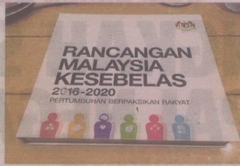
Tweet Najib mengenai dokumen RMKe 11 yang akan dibentangkan di Parlimen, hari ini.

bangunan inklusif dan mengenal pasti sumber pertumbuhan baharu.