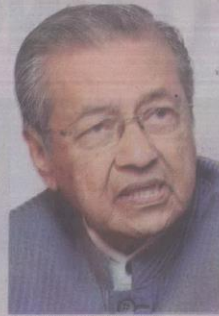
DR. MAHATHIR MOHAMAD

RAIS: Ya, itu mesti kita tolak sebab lunasnya seseorang Perdana Menteri jika hendak berundur mesti mengikut fasal dalam Perlembagaan. Beliau dilantik di bawah perkara 43 dan mesti ada undi tidak percaya di Parlimen jika hendak menurunkannya. Begitu pun UMNO juga memainkan peranan. Oleh kerana UMNO tidak ada membuat gesaan seperti itu dan Parlimen tidak ada juga gesaan serupa, maka apa yang digesa oleh Dr. Mahathir out of order . Jadi, di situ barangkali sahabat lama yang baharu terasa. Haji Hadi (Presiden Pas, Datuk Seri Abdul Hadi Awang) punya komen (mempertahankan Najib, minta beliau tidak letak jawatan) itu pun relevan. Kita harus berterima kasih kepada