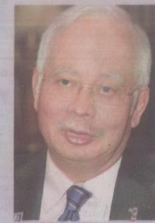
NAJIB TUN RAZAK

Siapa yang akan dapat untung daripada kemelut ini?