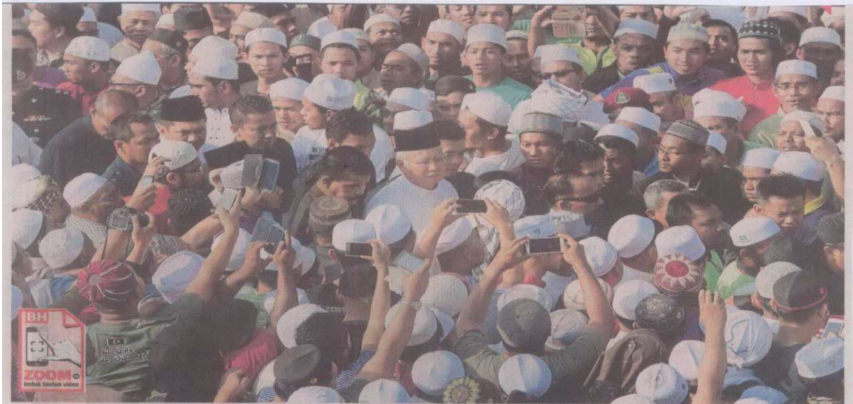
Najib hadir memberi penghormatan terakhir kepada Nik Aziz yang meninggal dunia di Kampung Pulau Melaka, Kota Bharu, semalam.