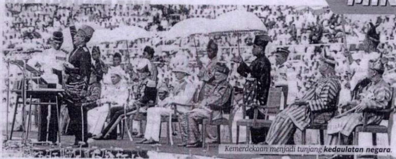
Kemerdekaan menjadi tunjang kedaulatan negara.

"Pada 1 Julai 1896, Persekutuan itu dibentuk dengan nama Negeri-negeri Melayu Bersekutu dengan antara lain Sultan bersetuju menerima seorang pegawai British bergelar 'Residen Jeneral,'" katanya.