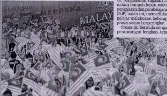
Generasi muda harus menghayati nilai sejarah tanah air.