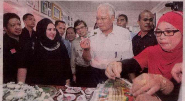
Najib mencuba Kek Lapis Sabok Tun Razak keluaran Mira Cake House ketika melawat Kampung Gersik di Kuching, malam tadi.

Yang hadir sama, Ketua Menteri Sarawak, Tan Sri Adenan Satem; Menteri Kemajuan Luar Bandar dan Wilayah Datuk Seri Shafie Apdal; Menteri di Jabatan Perdana Menteri, Nancy Shukri dan Menteri Keaja Raya,