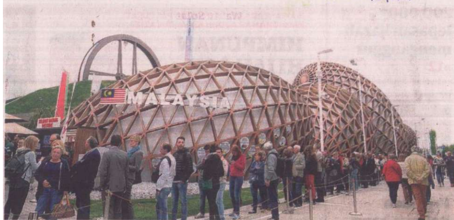
PAVILION Malaysia yang mempamerkan pelbagai produk tempatan sempena Expo Milan 2015 menarik purata 15,000 pengunjung setakat ini. Ia berasaskan reka bentuk biji benih menggunakan teknologi tempatan 'Glulam' sebagai simbolik pertumbuhan negara berasaskan pertanian.

menjadi tumpuan bagi pelaburan langsung asing dan merupakan pamacu ekonomi sedang pesat membangun bagi ekonomi global hari ini.