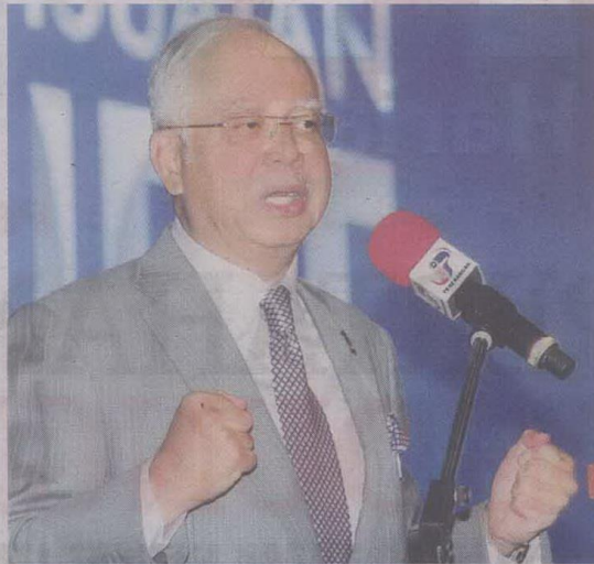
Najib ketika mengumumkan Pengubahsuaian Bajet 2016 di Putrajaya, semalam.

"Pucuk pangkalnya, perlu difahami baik-baik, bahawa apa yang sedang dihadapi, bukanlah kerana kegagalan kerajaan merancang, tetapi kemelut ekonomi global yang terus melanda dan di luar kawalan ki-