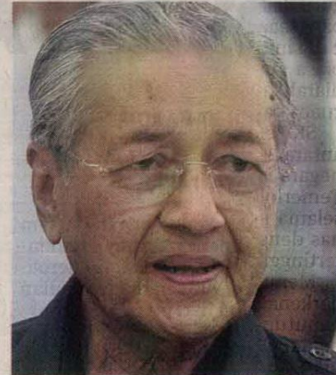
DR. MAHATHIR MOHAMAD

Pada 1983, Dr. Mahathir mengejutkan Britain dengan dasar Buy British Last . Bayangkan selepas sebuah syarikat milik negara kecil seperti Malaysia mengambil alih sebuah syarikat perladangan Britain, ia kemudian mengisytiharkan