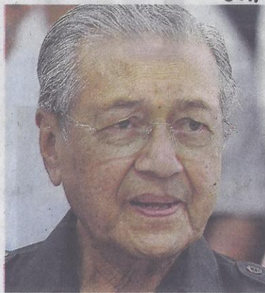
DR. MAHATHIR MOHAMAD