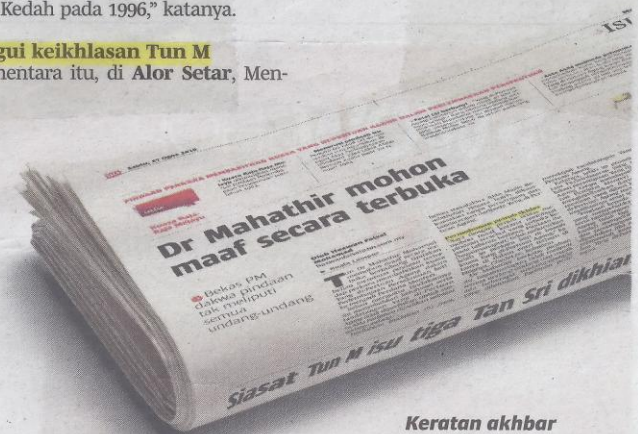
Keratan akhbar BH, semalam.

"Beliau minta maaf selepas keadaan menjadi semacam ini... kalau dulu tak minta maaf pada sesiapa-pun," katanya selepas merasmikan Mesyuarat UMNO Bahagian Alor Setar di sini, semalam.