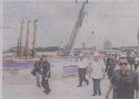
NAJIB melawat sekitar tapak projek pembangunan Warisan Merdeka yang turut menempatkan bangunan Merdeka PNB118 di Kuala Lumpur semalam.

Turut hadir Menteri Wilayah Persekutuan, Datuk Seri Tengku Adnan Tengku