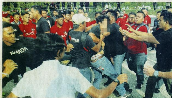
SEORANG ahli Armada PPBM dipukul oleh ahli-ahli pertubuhan itu kerana dituduh mencetuskan kekecohan, bagaimanapun siasatan mendapati dia tidak terlibat.

Bagaimanapun tiada sebarang kejadian tidak diinginkan berlaku kepada bekas Perdana Menteri itu apabila beliau dan isterinya, Tun Dr. Siti Hasmah Mohd. Ali diberi perlindungan oleh pengawal peribadinya dan segera dibawa keluar dari dewan.