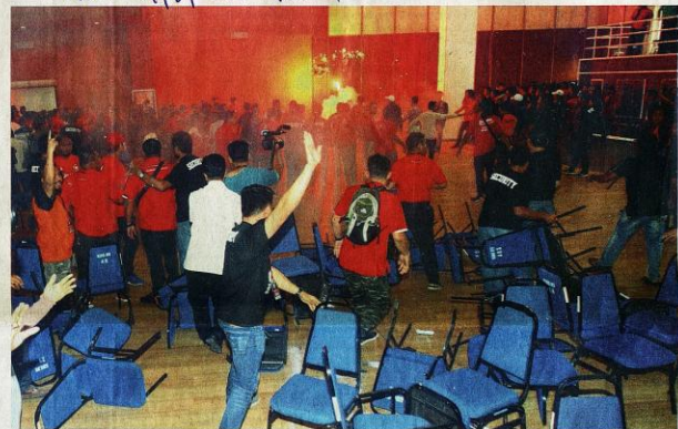
KERUSI dilempar dan dirosakkan oleh peserta forum.