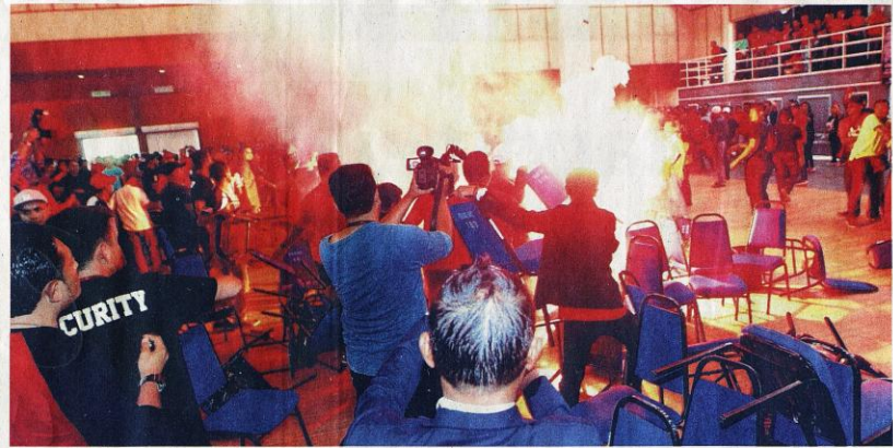
TINDAKAN peserta yang terdiri daripada ahli-ahli Armada PPBM membakar suar ketika Forum Nothing To Hide 2.0 mencetuskan keadaan huru-hara di Dewan Raja Muda Musa, Seksyen 7, Shah Alam, Selangor, semalam.