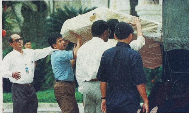
TILAM yang diusung ke mahkamah adalah antara perkara menarik perhatian rakyat tempatan dan masyarakat antarabangsa ketika percicaraan kes liwat melibatkan Anwar Ibrahim pada 1998.

Ia sudah berlaku awal lagi selepas pilihan raya umum 1969 yang kali pertama menyaksikan parti