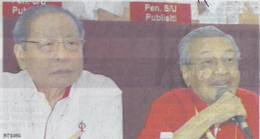
DR. Mahathir Mohamad bersama Lim Kit Siang dalam sidang media pada Persidangan Parti DAP 2016 di Shah Alam.

Menurut Tunku Abdul Aziz, berdasarkan pemerhatiannya, hubungan antara Pas, PPBM dan DAP akan berkecai apabila Dr. Ma