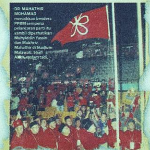
KERATAN akhbar Mingguan Malaysia semalam.