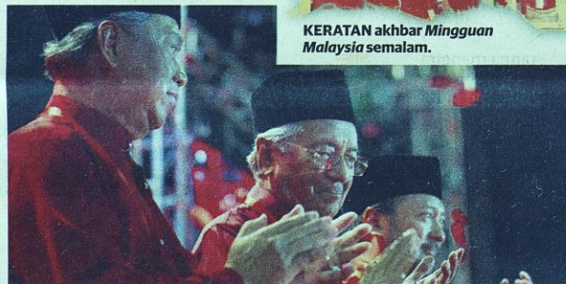
MUHYIDDIN YASSIN (kiri), Dr. Mahathir Mohamad dan Mukhriz Mahathir (kanan) bertepuk tangan semasa pelancaran Parti Pribumi Bersatu Malaysia (PPBM) di Stadium Malawati, Shah Alam, malam kelmarin.

13 Januari lalu yang dikatakan menengahkan anggotanya supaya mengaku sebagai ahli PPBM untuk hadir beramai-ramai pada pelancaran parti itu malam semalam.